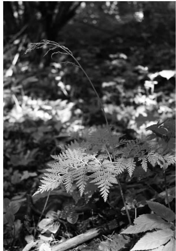
Fig. 2 Individuo fertile di Botrychium virginianum nella Valle di S. Lucano. Fertile specimen of Botrychium virginianum in the S. Lucano Valley.